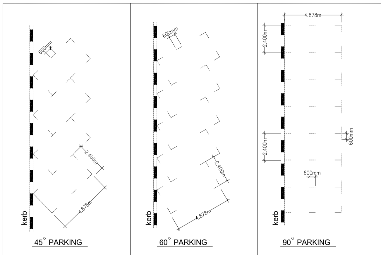
PELAN TEMPAT MELETAK KERETA